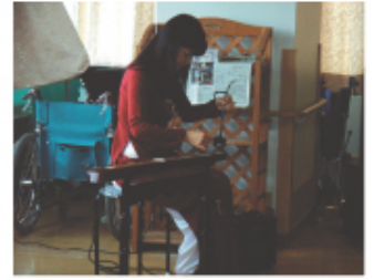
民族楽器の演奏会